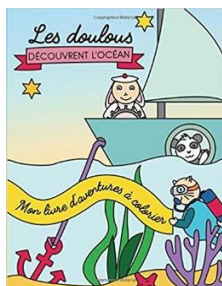
Les Doulous découvrent l'océan , Pegasus Kids, 2017