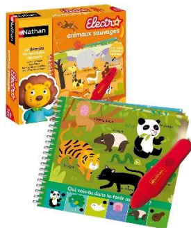
Je découvre les animaux sauvages , édition Nathan, 2011