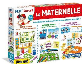
La maternelle, jeu éducatif, édition Clementoni, 2013