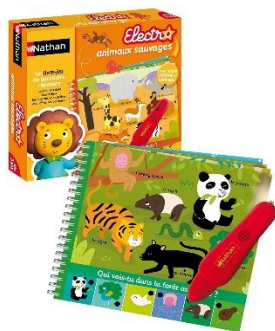
Je découvre les animaux sauvages , édition Nathan, 2011