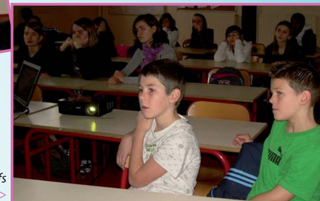
Les élèves attentifs aux résultats de l'enquête >

« Certaines questions étaient faciles, d'autres étaient plus difficiles »