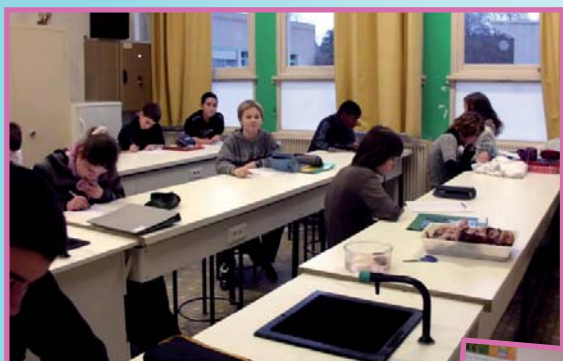
Les classes de 5ème remplissent le questionnaire sur l'eau