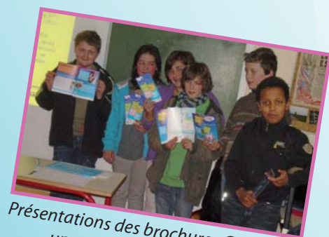
Présentations des brochures C.l.eau par un groupe d'élèves de 5ème