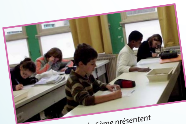
Les élèves de 6ème présentent un questionnaire sur l'eau en atelier éco-l'eau