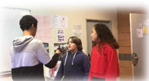
« Cultivons notre jardin » Collège Clos St Vincent – Noisy-le-Grand (93)