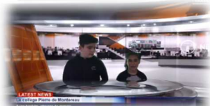
« A vos baskets, citoyens de demain ! » Collège Pierre de Montreuil – Montreuil-Fault-Yonne (77)