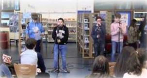
« Les jeunes qui fuient » Collège Blanche de Castille – La Chapelle-la-Reine (77)