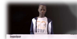
« France pays des libertés » Lycée professionnel Jean Rostand – Mantes-la-Jolie (78)