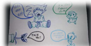
« Et si on en parlait » Lycée François Truffaut – Bondoufle (91)