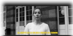
« Liberté d'expression » Collège Paul Bert – Paris (75)