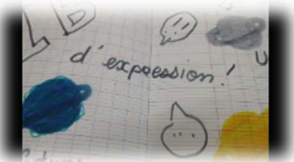
« La liberté d'expression il faut y faire attention » Collège Le Grand Parc – Cesson (77)