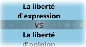
« La liberté d'expression VS La liberté d'opinion » Collège Condorcet – Dourdan (91)