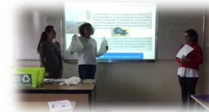
« Trier ses déchets » Lycée Gaston Bachelard – Chelles (77)