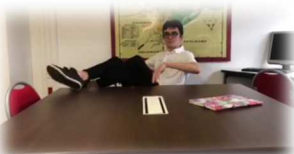
« Engagement politique » Collège Le Rondeau – Rambouillet (78)