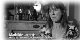
« A la recherche des symboles de la république » Service Oscar Romero – Paris (75)