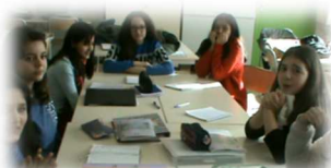
« Les petits journalistes » Collège Descartes - Soisy-sous-Montmorency (95)