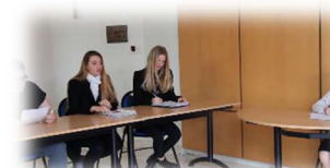
« La justice et le citoyen » Lycée St Louis Ste Clothilde – Le Raincy (93)