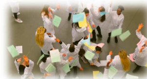
« Big Guy » Lycée Léonard de Vinci – St-Michel-sur-Orge (91)