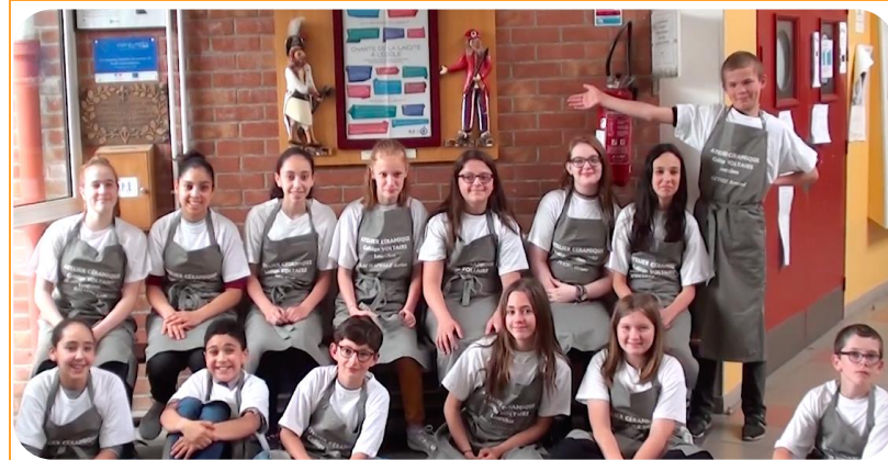
« Notre Eveil à la citoyenneté » Collège Voltaire (Lourches 59)