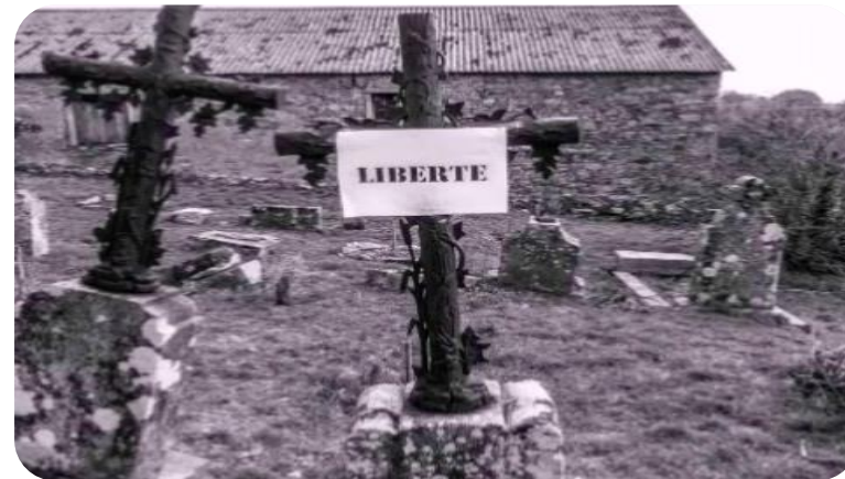
« Éveille-Toi » Collège Antoine Courrière (Cuxac Cabardès 11)