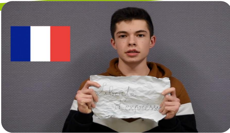
« Les justiciers de la liberté » Lycée La Mennais (Ploërmel 56)