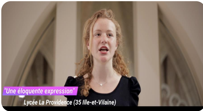
"Une éloquente expression" Lycée La Providence (35 Ille-et-Vilaine)